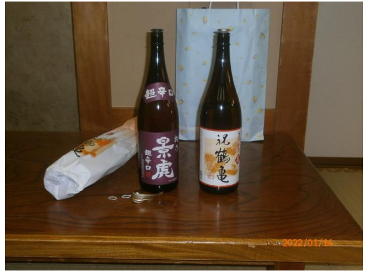
L 前田から銘酒のご提供戴きました。