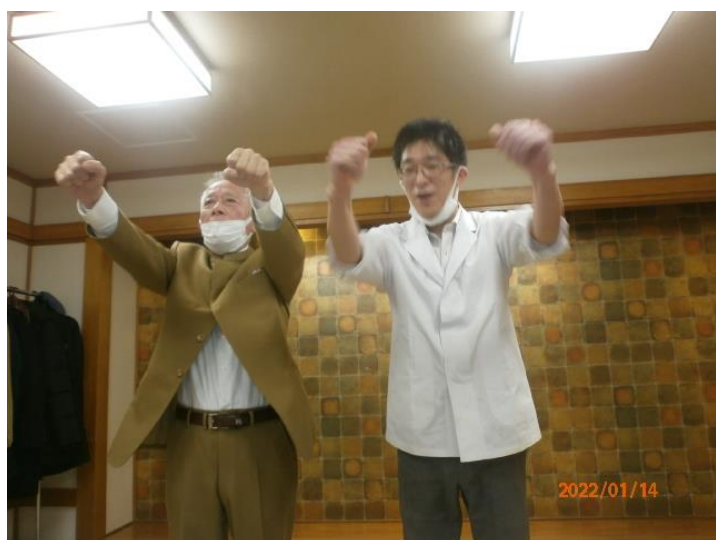
入会承認を受けライオンズローア