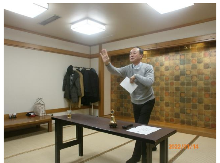
L 浅水出席率発表。今回 54.5%。前回補正 68.2%。 ボールは押し出すようにして投げる・・・と 体現してレクチャー戴きました。