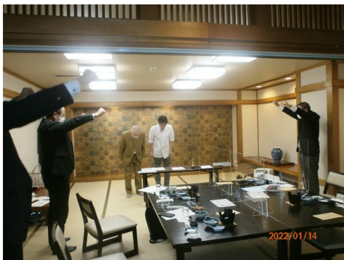
歓迎のライオンズローア