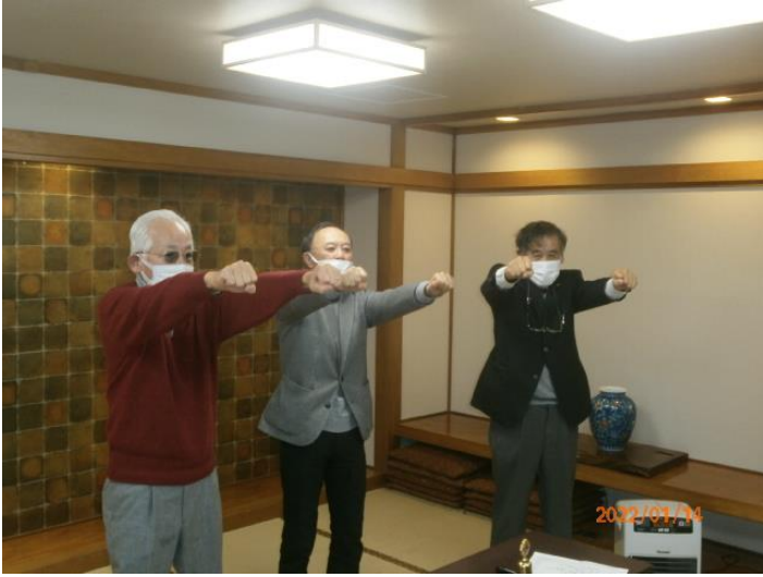
30年マイルストーン・シェブロンアワードL高野。L高野から30年同志L浅水も・・・とお声掛け。