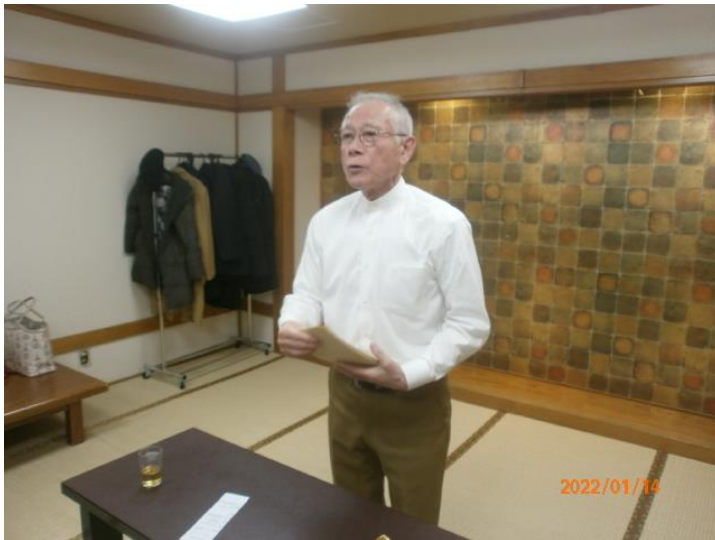
L 山田テール。今日大活躍。 ありがとうございました。