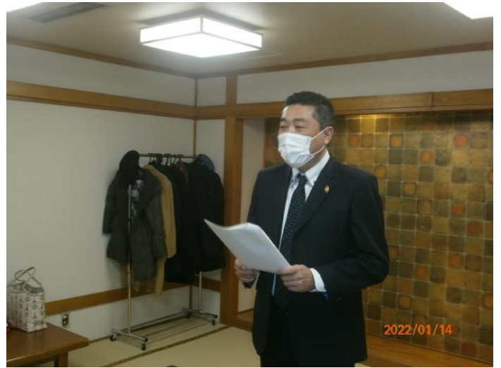
新年例会開始。実行委員長L山口。理事会にリモートで参加載っています。